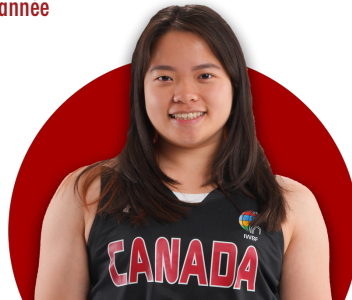
PUISAND LAI Athlète féminine de l'année